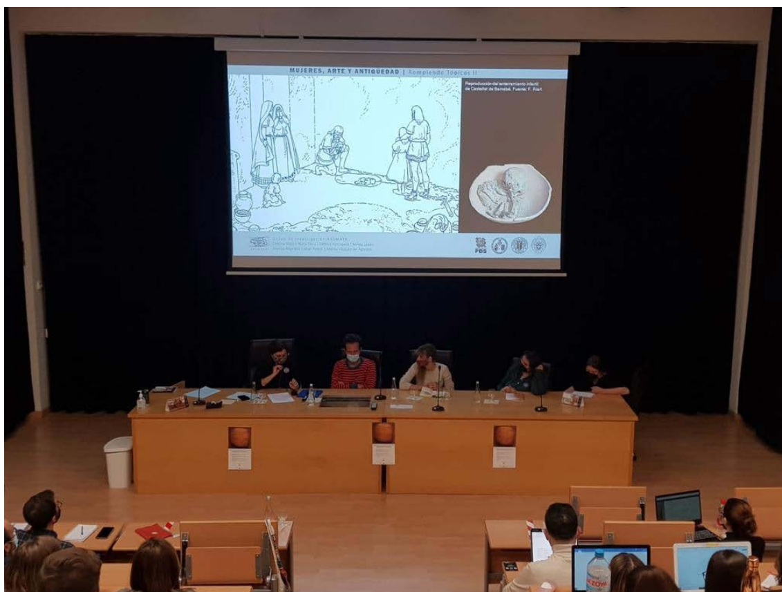
Fig. 2: Celebración del Seminario Permanente Mujeres, Arte y Antigüedad. Rompiendo Tópicos II .

de 2021. La actividad se realizó también en la Facultad de Geografía e Historia, pero en este caso de forma totalmente presencial por parte del alumnado [Fig.2].