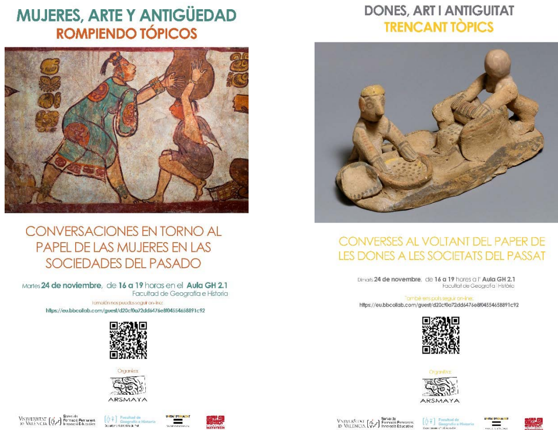
Fig. 1: Carteles del Seminario Permanente Mujeres, Arte y Antigüedad. Rompiendo Tópicos I . Arsmaya 2020.

Esta primera edición de las jornadas nació con un formato diferente y más ágil. En lugar de impartir las conferencias de la manera tradicional, se optó por una mesa de debate en la que, a modo de conversación, iban interviniendo los distintos participantes invitados. Ello permitió que se abordaran aspectos muy variados relacionados con las mujeres y la Historia, tales como la perspectiva de género en el estudio del pasado, los papeles y lugares que ocuparon las mujeres en la Antigüedad a través de diferentes casos de estudio pertenecientes a cronologías y áreas geográficas diversas, la contribución al sistema económico que las descendientes de esas mujeres del pasado tienen en la actualidad en sus comunidades, la situación actual de los estudios de la historia de las mujeres, expectativas y acciones futuras, el papel de los medios de comunicación en la difusión de estos temas basada en la perspectiva de género y, por último, un acercamiento a cómo se está incorporando la presencia de las mujeres en los discursos museográficos. En conjunto, las sesiones tuvieron un gran éxito y contaron con la asistencia de más de un centenar de personas, algunas de ellas con asistencia virtual, ya que, debido a las restricciones establecidas por la situación de pandemia mundial, el aforo del salón era de solo 75 personas.