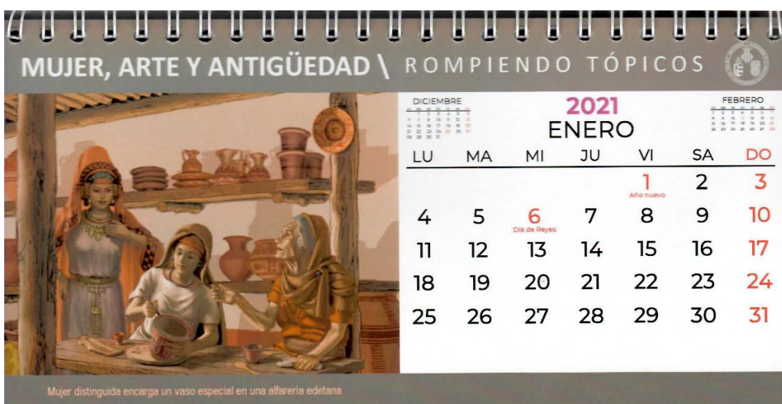
Figs. 3 y 4: Calendario del 2021 elaborado por el grupo de investigación Arsmaya. 2021.