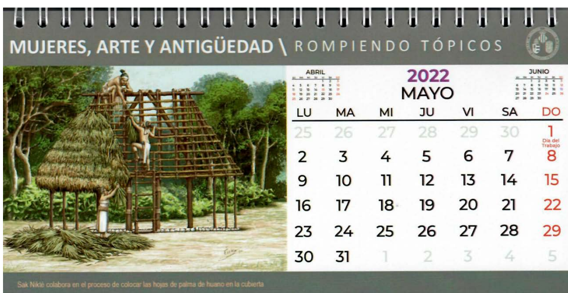
Figs. 5 y 6: Calendario del 2022 elaborado por el grupo de investigación Arsmaya. 2022.